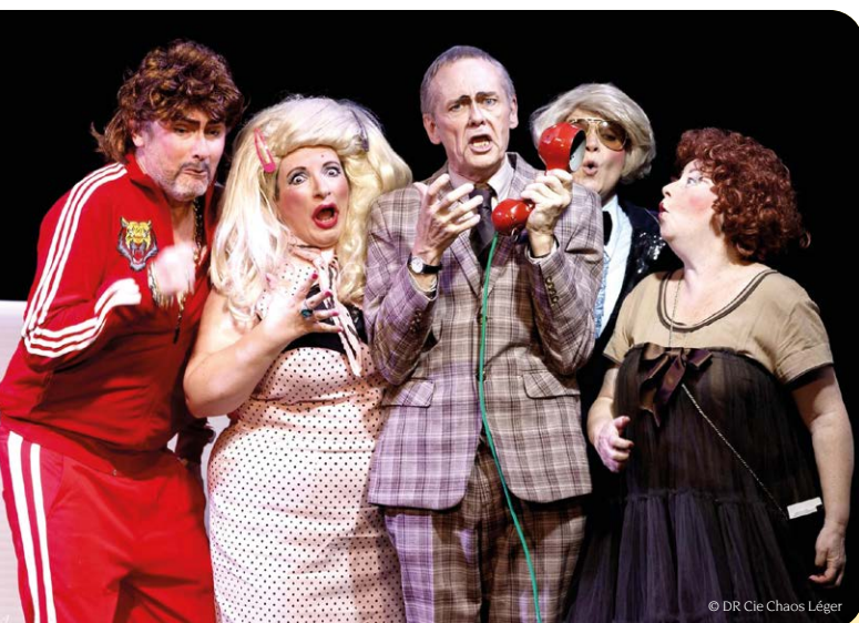
La Cie Chaos Léger (75). Plus on avance, spectacle programmé au Mondial de Monaco 2025 pour la participation de la France.