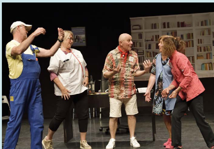
Cie Cassiopée (83), 14 juillet à la maison de retraite , de Pascale Valentini-Daniel