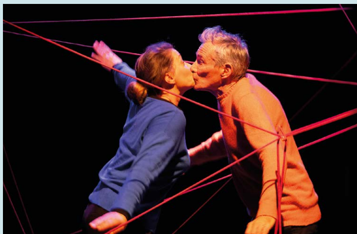
Cie de 9 à 11 (31), Émois , de Rémi De Vos