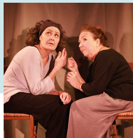
Cie des Elles (51), La Nostalgie des blattes , de Pierre Notte