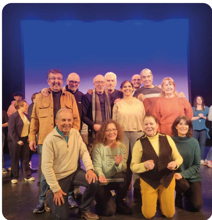
La Compagnie Théâtrale IL et le 15 ème Masque d'Or

Richard III n'aura pas lieu de Matei Visniec, par la Compagnie Théâtrale IL (83) a gagné le 15 ème Masque d'Or.