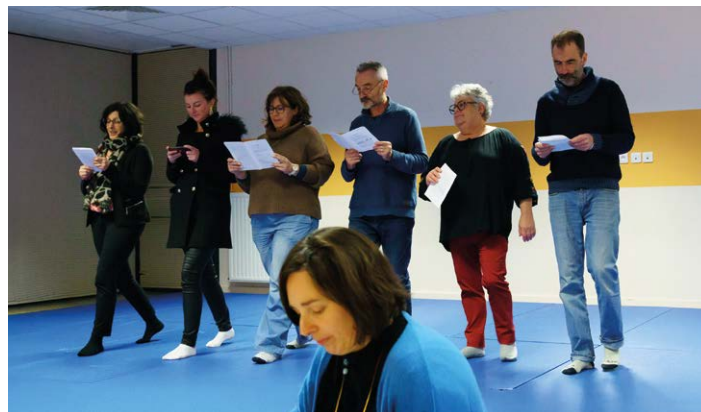
Le Théâtre de la Comté (63)

Via un mail à vpformation@fncta.fr , il vous suffit de décliner votre identité, votre département de résidence, votre compagnie et votre numéro de téléphone. Vous serez ensuite contacté par un des deux co-vice-présidents formation qui vous expliquera plus en détail ce parcours.