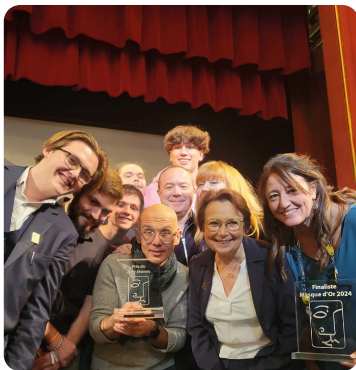
La troupe Théâtre sur Cour et le Prix du Jury Jeunes