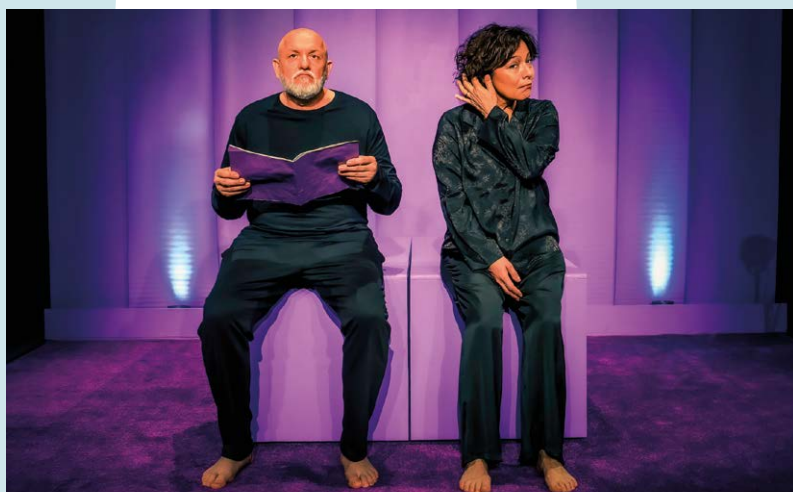
Cie Antrios (66), Retour de Madison , d'Eric Assous