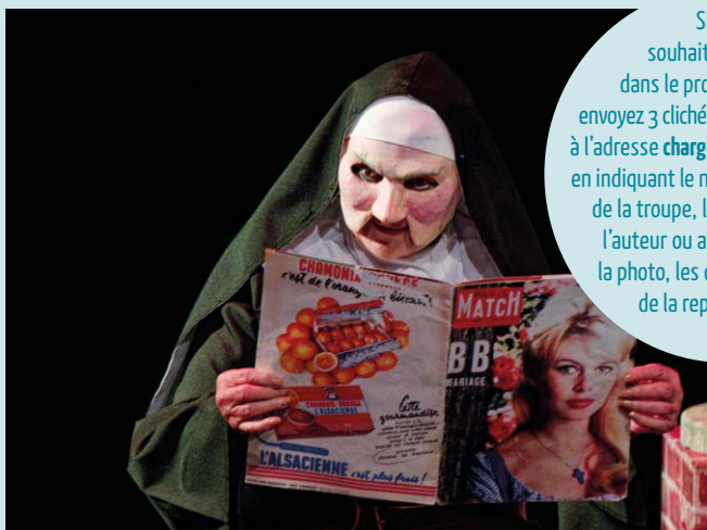
Cie LéZardiZenscène (78), Le Vent des peupliers , de Gérald Sibleyras

Si vous souhaitez paraître dans le prochain numéro, envoyez 3 clichés de moins de 6 mois à l'adresse chargedemission@fncta.fr , en indiquant le nom et le n° adhérent de la troupe, le titre de l'œuvre, l'auteur ou autrice, la date de la photo, les crédits et le cadre de la représentation.