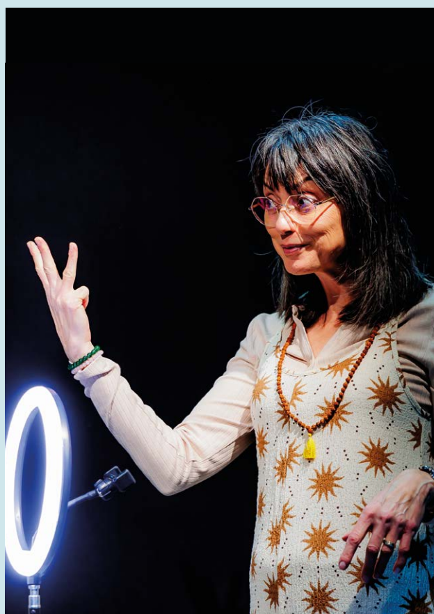
Cie Théâtre Pour Demain Et Après (12), Les Trois huit , création