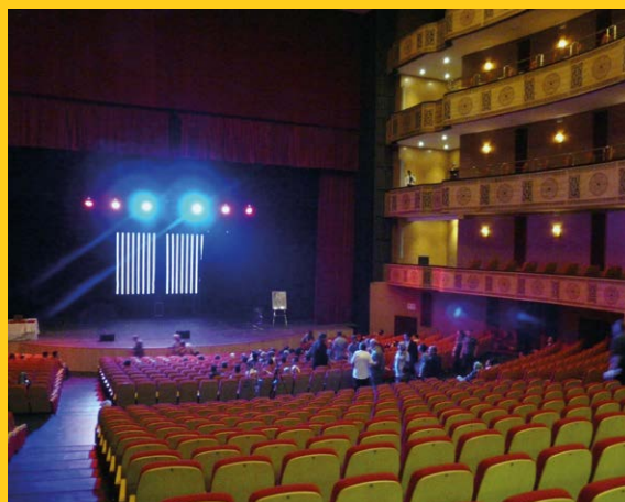
Le Théâtre Mohammed VI à Oujda, Maroc