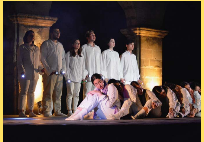
La Cie Et Cetera Tbilisi (Géorgie), Met Mr William, au Festival Shakespeare & Cie 2023.

Tout savoir sur www.festivalshakespeare.fr .