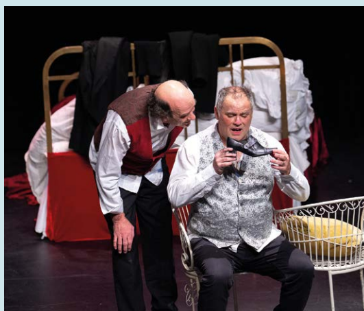
Cie Baladins de Marly (78), L'Affaire de la rue Lourcine , d'Eugène Labiche