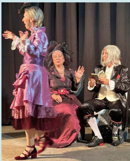
Cie H2O – les pantins (94), Les Savantes ridicules , d'après Molière