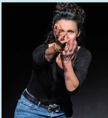
Cie Carpe Diem (76), Girls and Boys , de Dennis Kelly