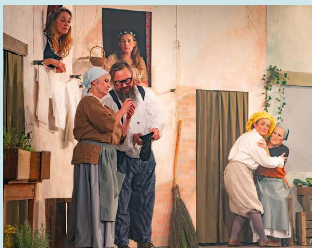
Cie du Chêne Sacré (41), Le Campiello , de Carlo Goldoni