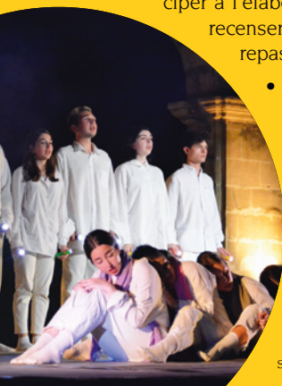
Cie Et Cetera (Géorgie), Merit Me - William, Festival Shakespeare & Cie, 2023