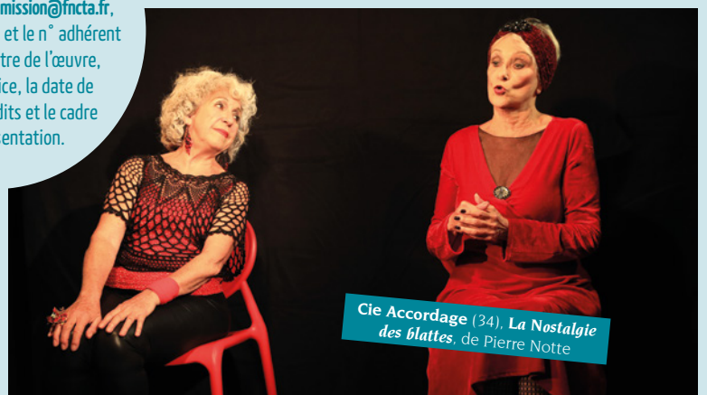
Cie Accordage (34), La Nostalgie des blattes , de Pierre Notte