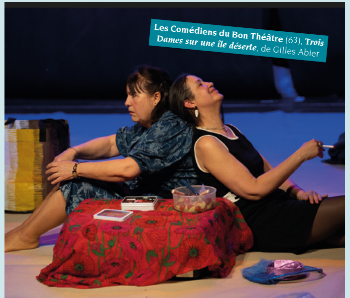
Les Comédiens du Bon Théâtre (63), Trois Dames sur une île déserte , de Gilles Abier

Dans ce nouveau numéro de Théâtre & Animation , la rédaction met en avant vos spectacles à travers une sélection de photos.