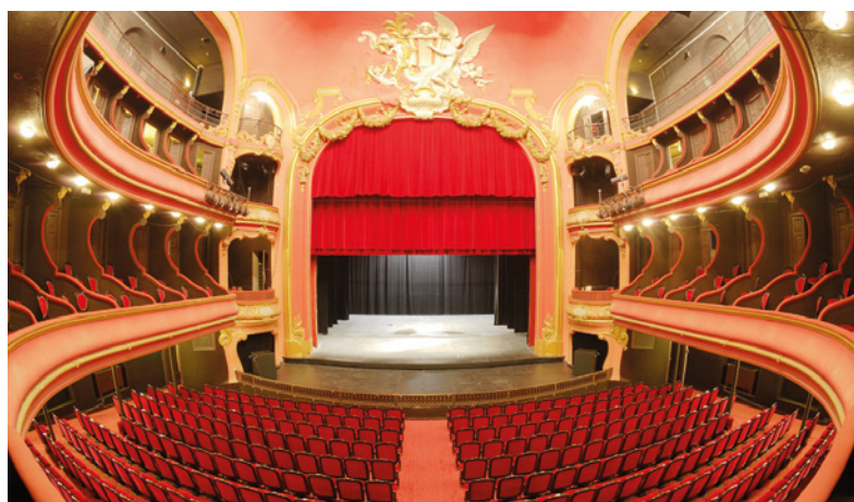
Théâtre du Casino Grand Cercle d'Aix-les-Bains (73)

Pour plus de précision, se référer au règlement sur le site www.fncta.fr