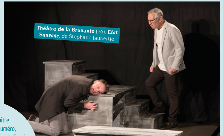
Théâtre de la Brunante (76), Etat Sauvage , de Stéphane Jaubertie