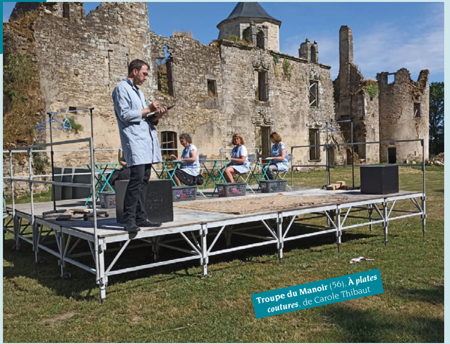
Troupe du Manoir (56), À plates coutures , de Carole Thibaut