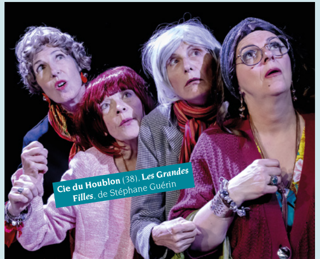
Cie du Houblon (38), Les Grandes Filles , de Stéphane Guérin