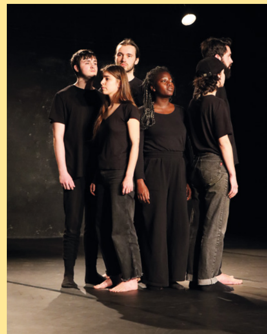
Cie Les Apprentis Sages (56), L'Homme qui marche , de Sandrine Le Mével Hussenet

La troupe Les Apprentis Sages a clôturé la journée du vendredi, à 22 heures, avec la pièce engagée L'Homme qui marche , de Sandrine Le Mével Hussenet. Sur scène, les comédiens et comédiennes de 20 ans portent le texte, exigeant, avec maîtrise. Cette représentation a su honorer la place qui lui a été donnée dans la programmation.