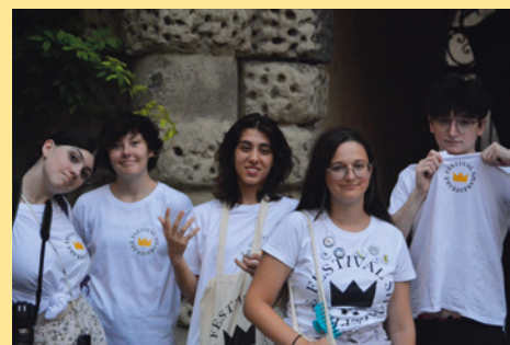
Les bénévoles du Festival Shakespeare & Cie, membres du Théâtre du Sycomore (07), 2023

Enfin, chaque jour des spectacles de compagnies amatrices internationales ont été joués par de jeunes adultes. Tout au long des festivités, divers ateliers ont été proposés sous forme de sessions quotidiennes : théâtre pour enfants, ateliers, écriture et musique.